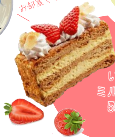
いちごの ミルクケーキ 550円 税込