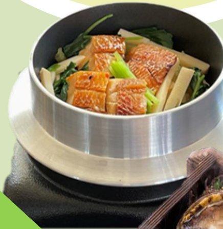
金目鯛の釜飯 税込 1,100円