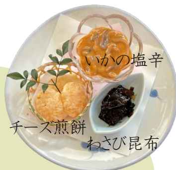
おつまみセット 3種盛り 550円 税込

花の舞/奥の松/ 3種/ 550円 税込 春鹿/若竹 など... 5種/ 1,000円 税込