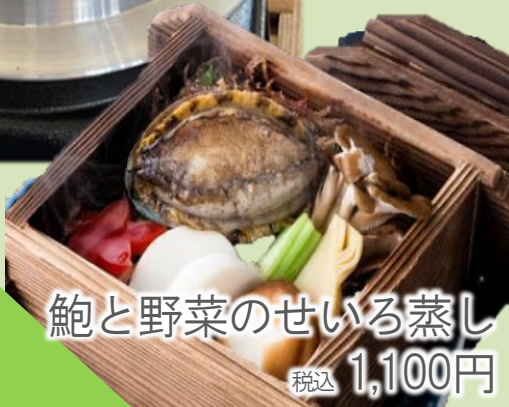
鮑と野菜のせいろ蒸し 税込 1,100円