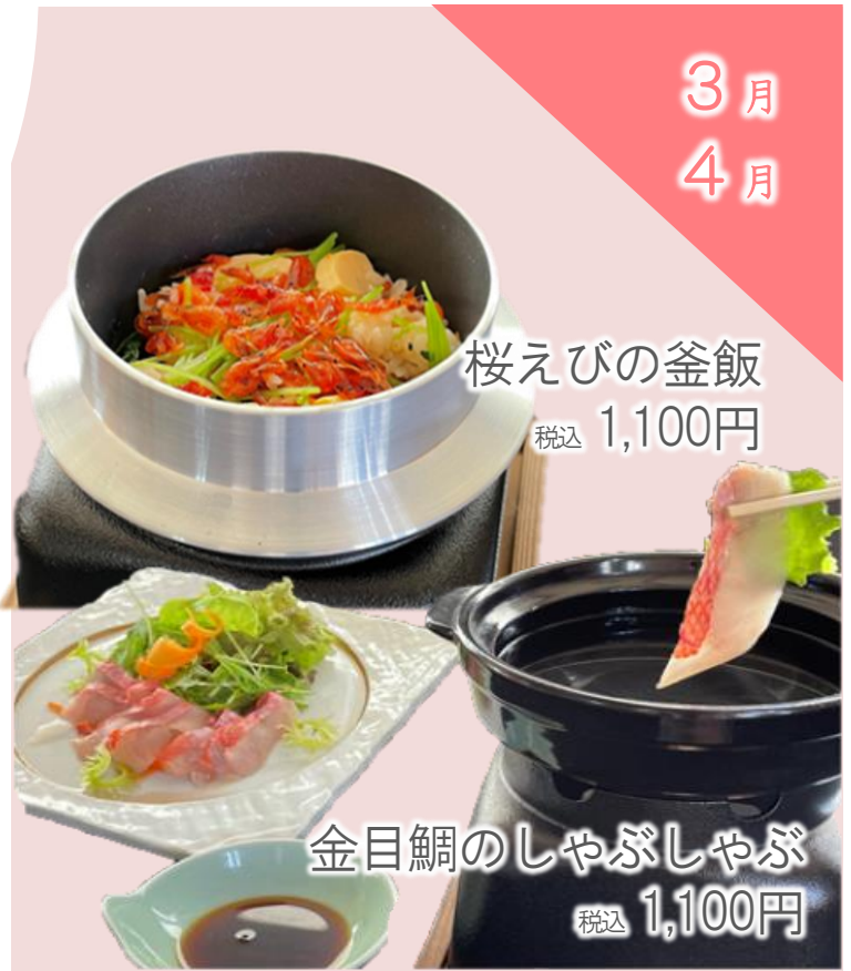
桜えびの釜飯 税込 1,100円