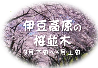
伊豆高原の 桜並木 3月下旬～4月上旬