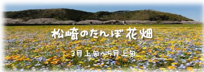
松崎のたんぽぽ花畑 3月上旬～5月上旬