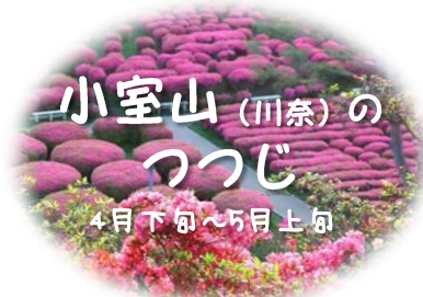
小室山(川奈)の つつじ 4月下旬～5月上旬