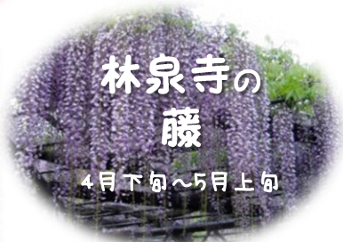
林泉寺の 藤 4月下旬～5月上旬