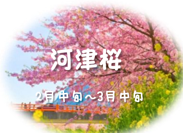
河津桜 2月中旬～3月中旬